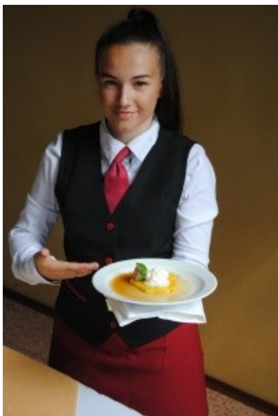
Ilustrace 5: ZZ 18 - Kuchař- číšník