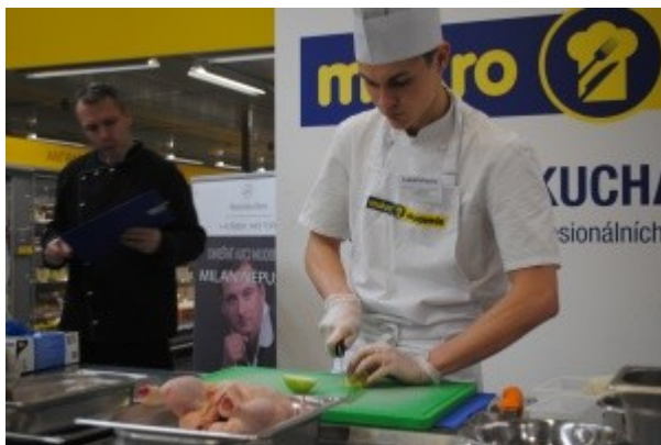
Ilustrace 18: MAKRO akademie 2018