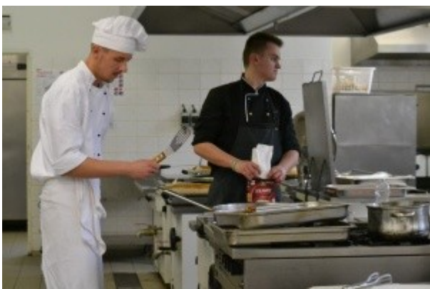
Ilustrace 9: Praktická MZ - obor HOT 2018