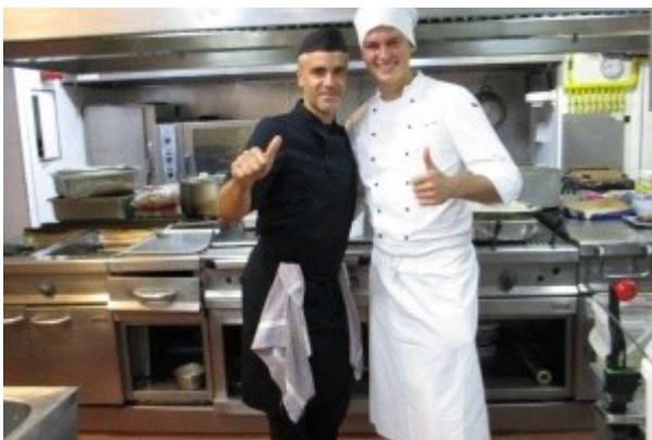
Ilustrace 27: Praxe ve Španělsku 2018