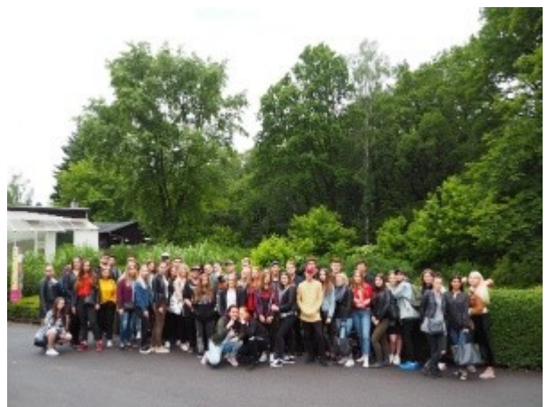
Ilustrace 28: Sportovní zážitkový týden 2018