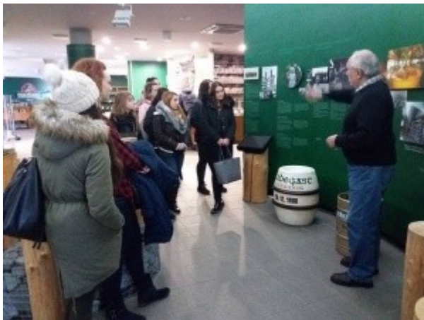
Ilustrace 32: Exkurze pivovar Radegast 2018