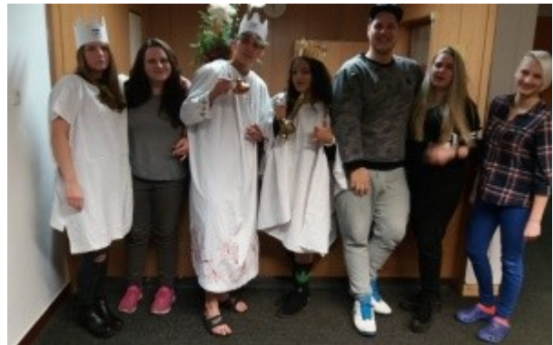
Ilustrace 26: DM 2018 - Třin králové