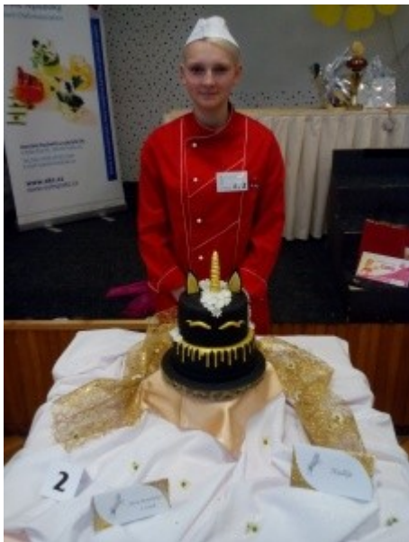
Ilustrace 19: PODBESKYDSKÝ JEŠTĚR 2018