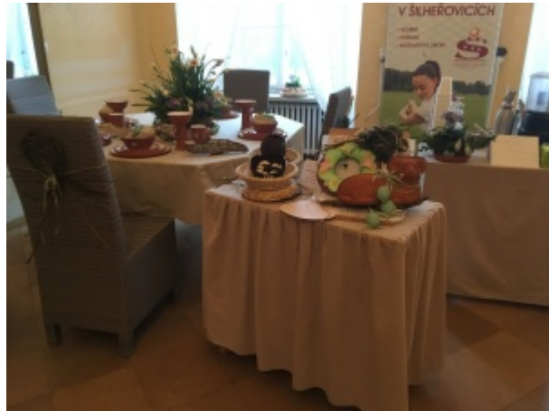
Ilustrace 31: Velikonoce na zámku Kravaře 2018