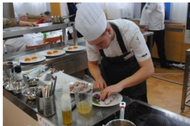
Ilustrace 16: Gastro Kroměříž 2018