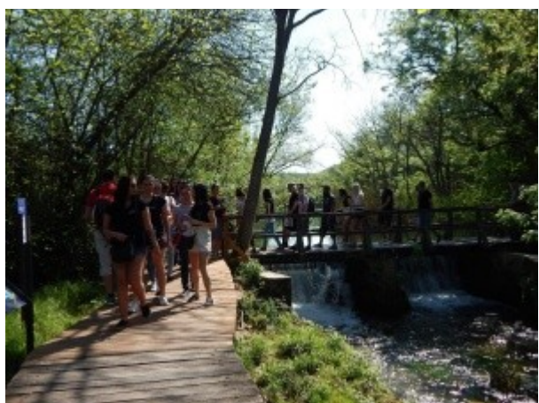
Ilustrace 12: Praktická MZ - obor CR 2018