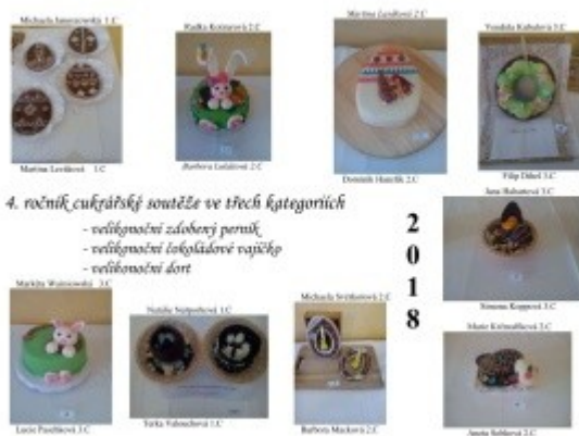
Ilustrace 21: Školní IV. roč. soutěže - Velikonoce v cukrárně 2018