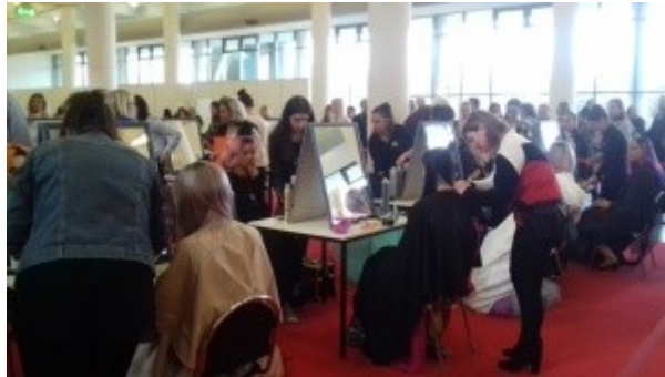
Ilustrace 23: HARMONIE Brno 2018