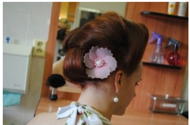
Ilustrace 4: ZZ 18 -obor Kadeřník