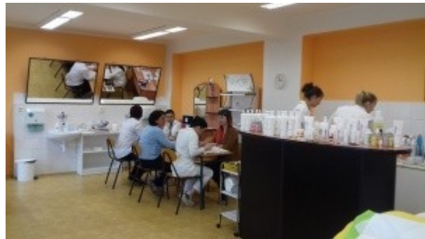
Ilustrace 7: Praktická MZ - obor KS 2018