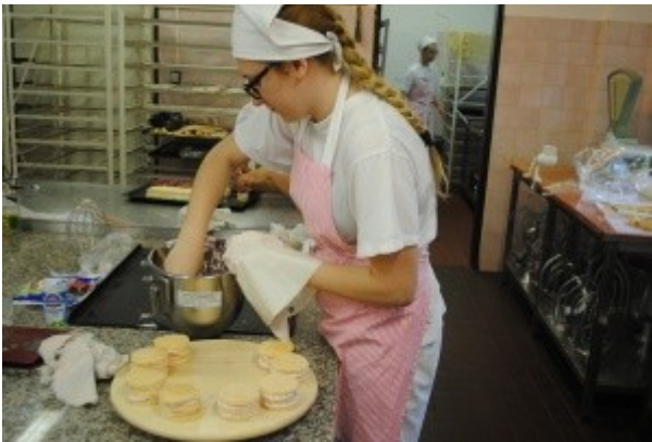
Ilustrace 1: ZZ 18- obor Cukrář