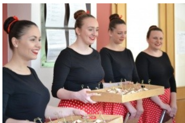
Ilustrace 10: Praktická MZ - obor HOT 2018