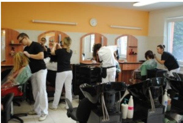
Ilustrace 3: ZZ 18 - obor Kadeřník