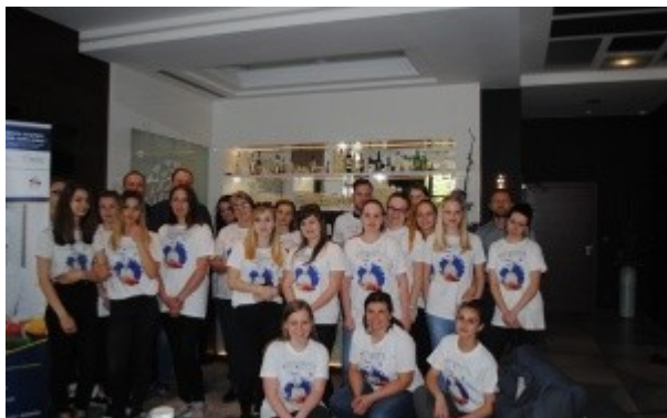
Ilustrace 34: Projekt PL škola - Výroba přírodní zmrzliny 2018