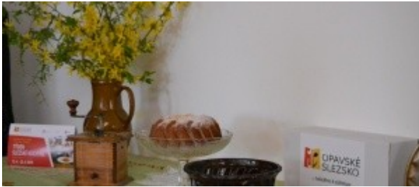
Ilustrace 30: Týden Slezské kuchyně 2018