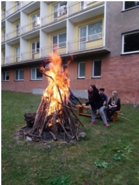
Ilustrace 25: Vítaní jara 2018