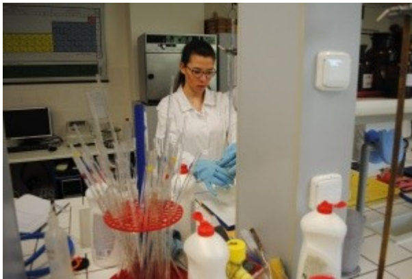
Ilustrace 14: Praktická MZ - obor AP 2018