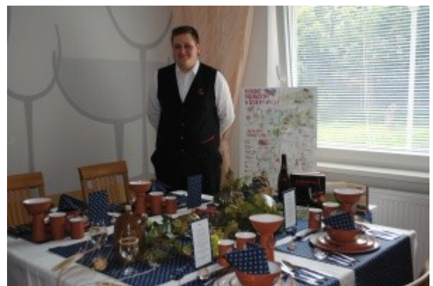
Ilustrace 6: ZZ 18 -obor Kuchař-číšník