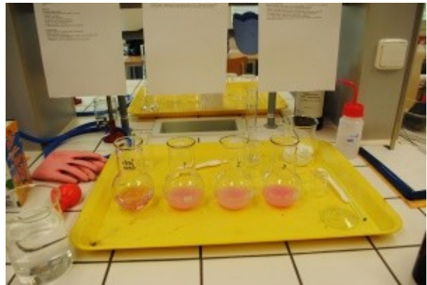
Ilustrace 13: Praktická MZ - obor AP 2018