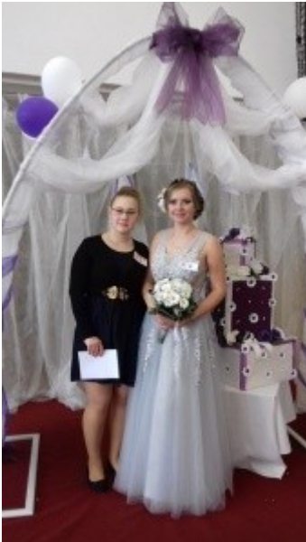
Ilustrace 22: ŠARM 2018 - Znojmo