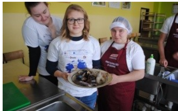
Ilustrace 33: Projekt škola PL - Mořské plody 2018