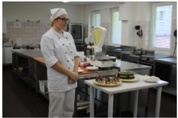
Ilustrace 2: ZZ 18 - obor Cukrář