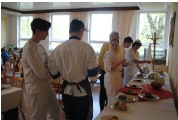
Ilustrace 15: Škola plná chutí 2018 - školní soutěž