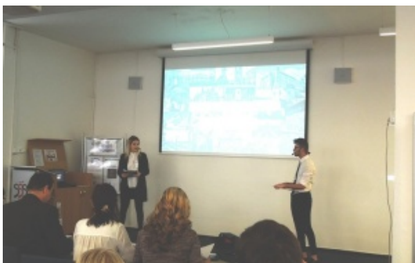
Ilustrace 24: Soutěž Mladý průvodce 2018