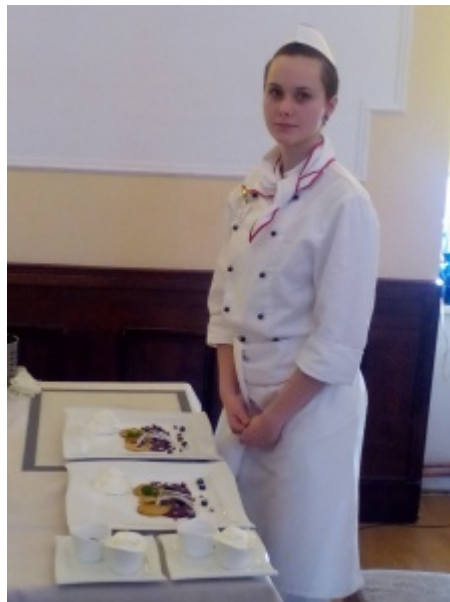
Ilustrace 20: O Priessnitzův dortík 2018