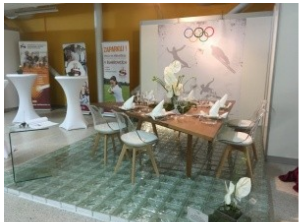
Ilustrace 17: Karneval chutí 2018