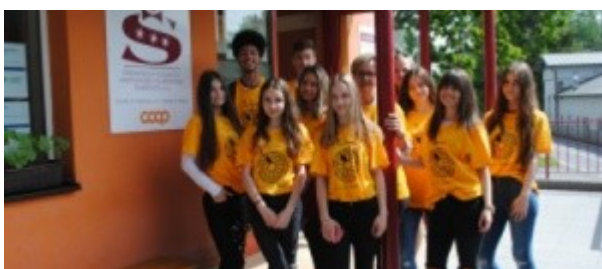
Ilustrace 29: Květinový den v Šilheřovicích -1. A -CR