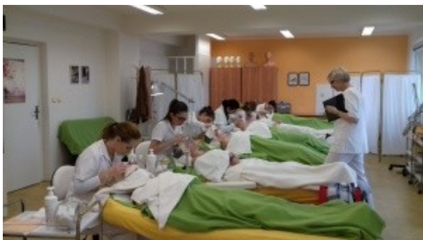
Ilustrace 8: Praktická MZ - obor KS 2018