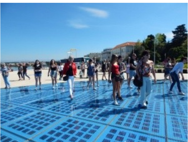
Ilustrace 11: Praktická MZ - obor CR 2018